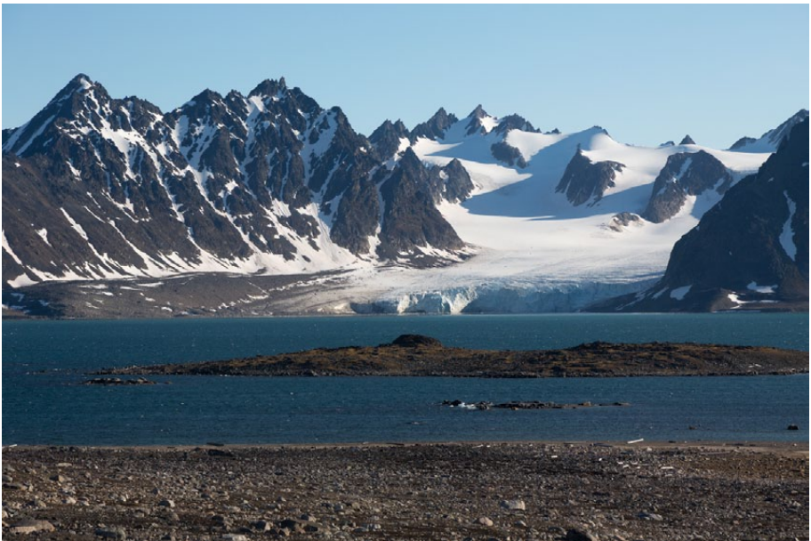
6.7.1-1: Smeerenburgfjorden med Frambreen, sett fra Danskøya.