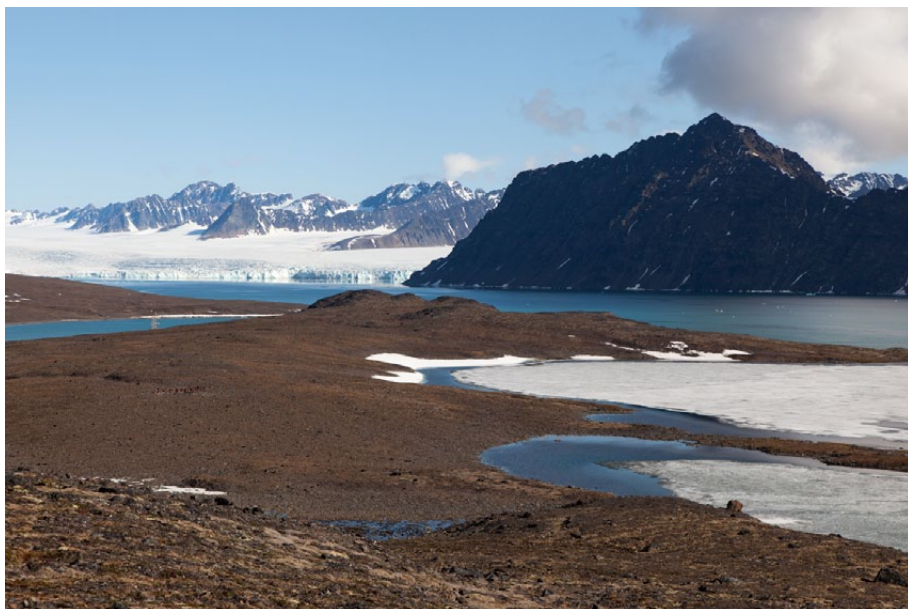
6.5-1: Landskap med innsjøer (til høyre), bukt (til venstre) og fjord (i mellomgrunnen). Signehamna i Krossfjorden. Lilliehöökbreen i bakgrunnen.