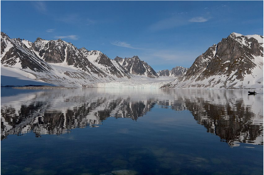
6.6.3: Fin sommerdag sent i juni i indre Magdalenefjorden, med Waggonwaybreen i midten.