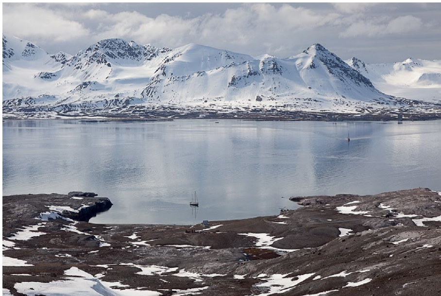
6.4.3-3: Peirsonhamna på Blomstrandhalvøya med den gamle marmorgruven London. Brøggerhalvøy med Ny-Ålesund i bakgrunnen. Midten av juni.